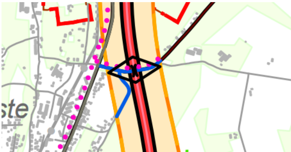
Joonis 1. Väljavõte Via Baltica teemaplaneeringu koondkaardist

Planeeringuala jääb osaliselt nii tee- ja teekaitsevööndisse (roosa ala) kui ka puhveralasse (kollane alla) (vt joonis 2). Teemaplaneeringu järgi on tee ja teekaitsevööndi alas planeeritud tee täiemahulise valmishitamiseni keelatud planeerida, projekteerida ja ehitada uusi hooneid ja rajatisi, rajada istandikke ning muuta maakasutuse sihtotstarvet. Erandina võib tee ja teekaitsevööndi alas Transpordiameti nõusolekul planeerida, projekteerida ja ehitada olemasoleval õuealal juurdeehitist või uut hoonet ning rajada tehnovõrkusid.